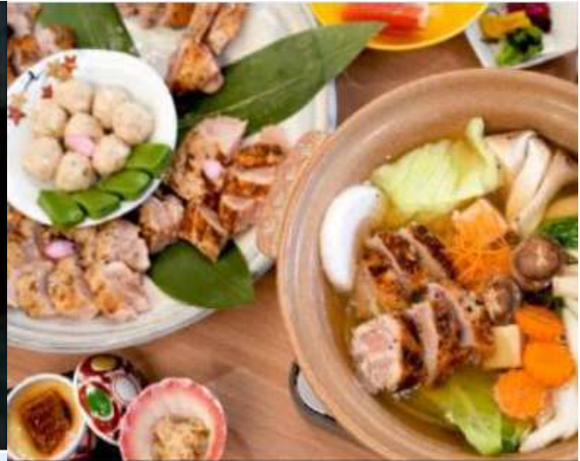
아리타산 닭고기 나베 (有田烏鍋コース)