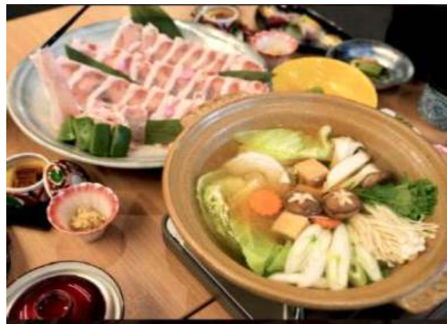
돼지고기 샤브샤브 (しゃぶしゃぶ鍋コース) (소고기/돼지고기/야채 별도요금 추가 가능) *소고기 샤브샤브 변경시 2,200엔 추가