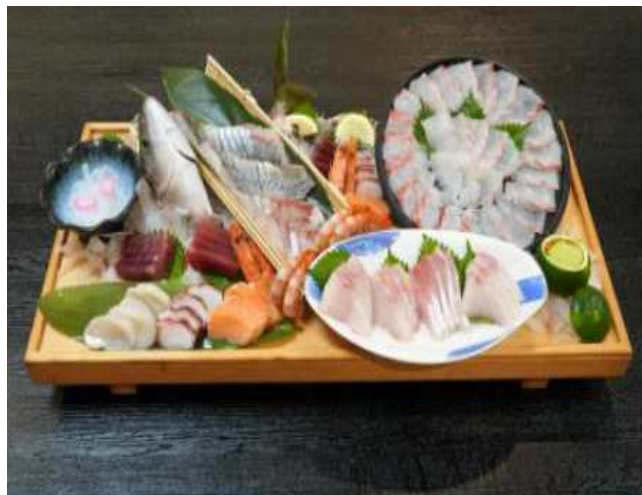
사시미 후나모리 (刺身船盛)